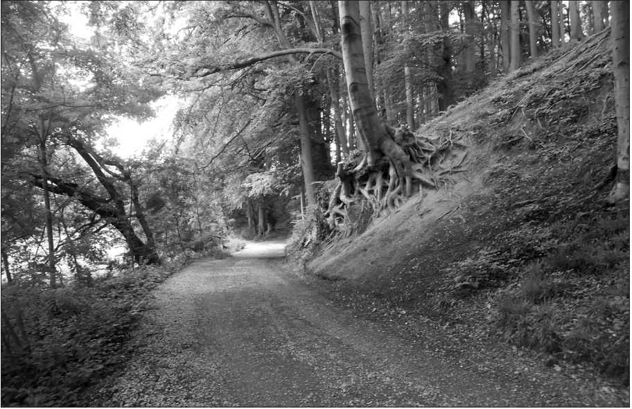
Weg am Fuße eines Hainsimsen-Buchenwalds zwischen Haus Morp und Papendelle

1992 wurde hier Landwirtschaft betrieben. Heute sind Stall und Scheunen zu Wohn- und gewerblichen Räumen umgestaltet. Trotz dieser modernen Veränderungen bietet Haus Morp zusammen mit einer großen Trauerweide immer noch einen schönen Anblick.