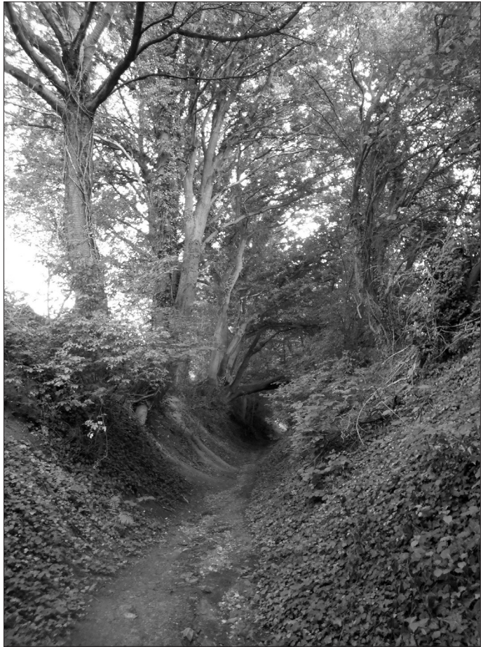
Hohlweg zwischen Schäpershof und Gerresheimer Höhen

Hohlweg. Pferdefuhrwerke haben früher beim Anstieg den Boden gelockert. Regen schwemmte die Erde zu Tal, so dass mit der Zeit eine tiefe Erosionsrinne entstand. Heute sind die Böschungen des Hohlwegs stark mit Gehölzen zugewachsen. Hier finden Pflanzen, Vögel, Insekten und Kleinsäuger einen Rückzugsraum in einer landwirtschaftlich genutzten Landschaft (so die Informationstafel am Ende dieses Hohlwegs).