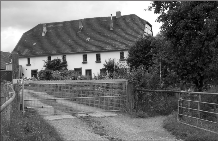
Papendelle im Morper Bachtal: Bauernhofidylle, umgeben von Kuhweiden, zwei Fischteichen sowie einem Obst- und Bauerngarten

»Gut Papendell mit seinen Teichen ist im Frühjahr immer der Platz, wo zuerst die von Afrika zurückkehrenden Schwalben gesehen werden können. Rauch- und Mehlschwalben jagen während des ganzen Sommers hier, und auch Uferschwalben lassen sich mitunter beobachten.«