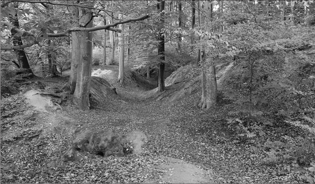
Hohlweg des Mauspfads im Hang südöstlich des Gerresheimer Friedhofs

knapp zwei Stunden vorbeigekommen sind. Bei einer Wanderwegetafel am oberen Eingang des Gerresheimer Waldfriedhofs verlassen wir für kurze Zeit den Mauspfad und folgen links dem Weg entlang des Maschendrahtzauns des Friedhofs.