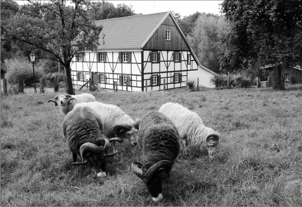
Fachwerkhaus (17. Jahrh.) des Naturschutzhofes Abshof im Rotthäuser Bachtal, davor »Skudden«, die zu den ältesten Hausschafzassen Deutschlands zählen (Foto entnommen aus dem Buch von Dr. Gerd Thörner über den Abshof).

alten Hofes, der in heutigen Karten den Namen »Plungscheuer« trägt, früher aber andere Namen innehatte. Die erste Erwähnung eines Hofes an dieser Stelle stammt aus dem Jahre 1392. Damals schenkte das bergische Herzogspaar dem Düsseldorfer Marienstift diesen Hof, der in der betreffenden Urkunde »Wüste Rotthaus in der Pfarrei Gerresheim« genannt wird. Später tauchten für diesen Hof die Namen »Plimsgut«, »Abshof« und »Gut Plungscheuer« auf. Im Jahre 1990 erwarb ein Düsseldorfer Arzt das heruntergekommene Anwesen und ließ die alte Hofstelle unter dem Namen »Abshof« neu aufleben. Das typisch bergische Hofstallhaus, ein schöner Fachwerkbau des 17. Jahrhunderts, sowie die große Feldscheune und die Schäferei wurden restauriert. Auf den umliegenden Grünflächen des Hofes werden alte Haustierrassen gehalten, eine